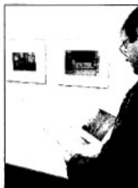
Muestra de Callahan