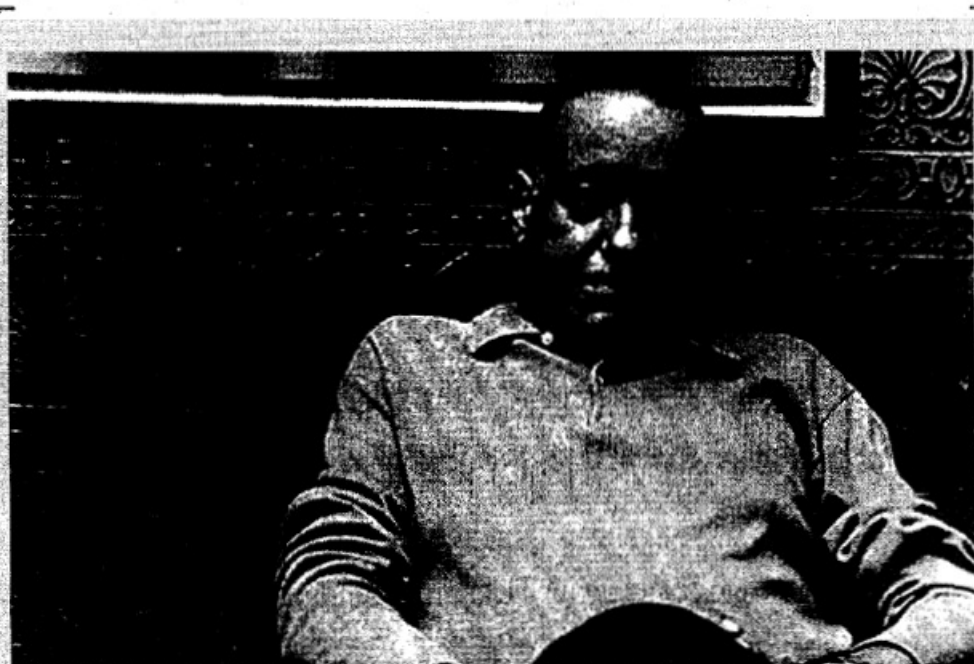
El escritor cubano Alejo Carpentier.

'El Acoso' fue un precedente en la riqueza expresiva del lenguaje